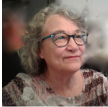
Mot de la présidente