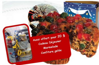
Des gâteries qui font du bien !